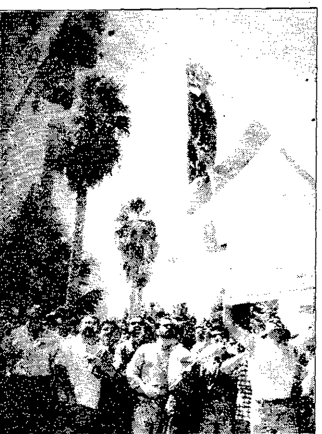
حرق العلم الاسرائيلي